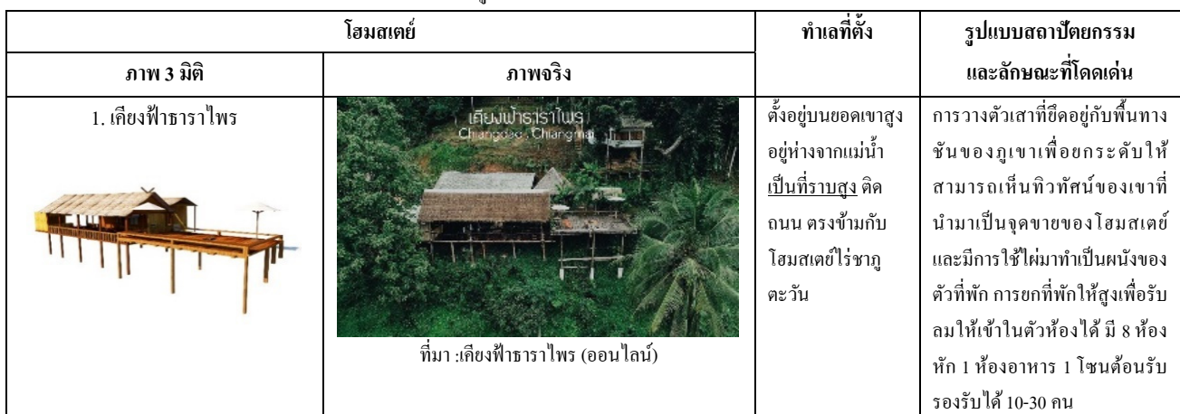
ตารางที่ 1 การศึกษาสถาปัตยกรรมของโฮมสเตย์หมู่บ้านแม่เมะ

โฮมสเตย์ส่วนมากตั้งอยู่บนพื้นที่ราบสูงติดเขาและที่ลาดชันริมแม่น้ำ ลักษณะทางสถาปัตยกรรมของตัวโฮมสเตย์มีบ้านยกสูง 2 ชั้น และ 3 ชั้น มียื่นระเบียงออกมาจากตัวบ้านที่หันออกไปเพื่อชมทัศนียภาพทางธรรมชาติ มีถนนเส้นหลักที่มีโฮมสเตย์บางกลุ่มตั้งเคียงไปกับทางถนน และบางกลุ่มต้องเดินเท้าเลียบเขาเข้าไป (ดังแสดงในตารางที่ 1)