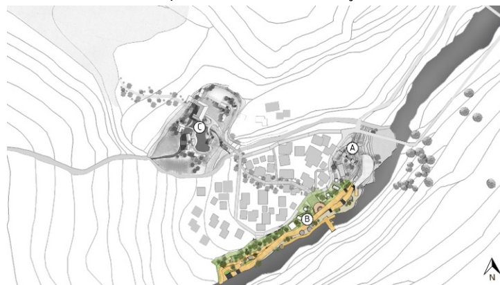
รูปที่ 9 เสนอแนะการวางผังที่พักโฮมสเตย์ ร้านค้า และทางเดินริมน้ำ

โครงการที่ 2 กลุ่มที่พักอาศัยโฮมสเตย์ ร้านค้าชุมชน และทางเดินริมน้ำ ตั้งอยู่ตำแหน่ง B ดังแสดงในรูปที่ 9 เป็นจุดสำคัญของโครงการในการกระจายนักท่องเที่ยวไปยังพื้นที่กิจกรรมต่างๆ การออกแบบเน้นสร้างประสบการณ์ดึงดูดลักษณะของชุมชน และจุดเด่นในพื้นที่ให้กับนักท่องเที่ยวได้สัมผัสในความหลากหลายของกิจกรรมและความงามของแม่น้ำน่านและธรรมชาติ เสริมสิ่งอำนวยความสะดวกให้แก่นักท่องเที่ยว เช่น ร้านค้าชุมชน ที่พักโฮมสเตย์ ห้องน้ำม้านั่ง ทางจักรยาน ป้ายบอกทาง โคมไฟ และถังขยะ เป็นต้น เพื่อเป็นเส้นทางแห่งการเรียนรู้วิถีชีวิต กิจกรรมประเพณี และการท่องเที่ยวเชิงนิเวศ ที่จะสร้างเศรษฐกิจชุมชนในพื้นที่ ดังแสดงในรูปที่ 10 และ 11