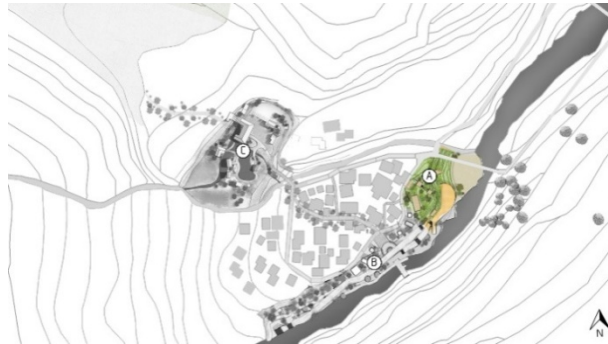
รูปที่ 6 เสนอแนะการวางผังศูนย์การต้อนรับนักท่องเที่ยวและส่งเสริมกิจกรรมทางน้ำ