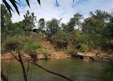
รูปที่ 10 แสดงภาพก่อนพัฒนาพื้นที่โครงการ 2 ที่มา : ภาพถ่ายจากผู้วิจัย พ.ศ. 2561