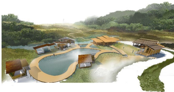
รูปที่ 13 แสดงทัศนียภาพศูนย์การเรียนรู้วิถีชีวิตห้วยพาน