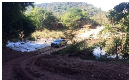
รูปที่ 7 แสดงภาพก่อนพัฒนาพื้นที่โครงการ 1 ที่มา: ภาพถ่ายของผู้วิจัย 2561