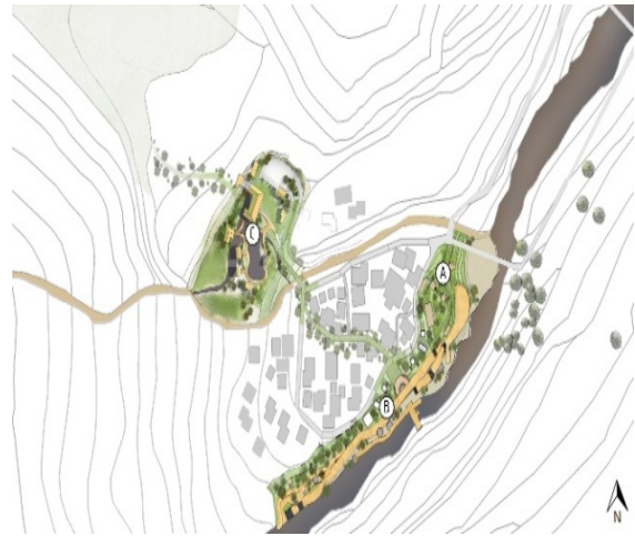
รูปที่ 16 แสดงผังการพัฒนาเชิงอนุรักษ์ของชุมชนบ้านห้วยพาน จ่านาน