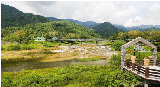
รูปที่ 1 แสดงภาพทางเข้าหมู่บ้านคีรีวง จ.นครศรีธรรมราช