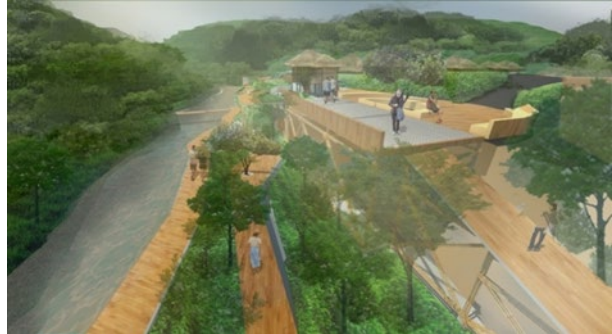
รูปที่ 11 แสดงทัศนียภาพที่พักโฮมสเตย์ ร้านค้าและทางเดินริมน้ำ

โครงการที่ 3 ศูนย์การเรียนรู้วิถีชีวิตห้วยพาน ตั้งอยู่ตำแหน่งที่ C ดังแสดงในรูปที่ 12 โดยให้นักท่องเที่ยวได้เรียนรู้วิถีชีวิตของชุมชนห้วยพานและการทำงานขั้นบันไดแบบดั้งเดิม ประกอบด้วย ศูนย์การเรียนรู้การทำนา ศูนย์การเรียนรู้วิถีชีวิต โรงเรียน ห้องสมุด ศาลารวมพลชุมชน ที่จอดรถยนต์และที่จอดรถจักรยาน ออกแบบโดยใช้ธรรมชาติเป็นตัวจัดสรร มีการดึงน้ำจากห้วยพานมาใช้ออกแบบภายในโครงการเพื่อการใช้งานในกิจกรรม สร้างเส้นทางเชื่อมโยงไปยังพื้นที่ทำนาเพื่อให้นักท่องเที่ยวเข้าถึงและเรียนรู้วิถีชีวิตการทำนาแบบดั้งเดิม ดังแสดงในรูปที่ 13 และ 14