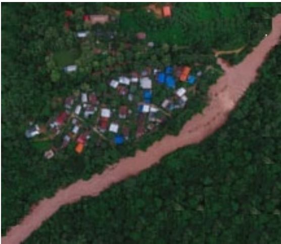
รูปที่ 15 แสดงภาพก่อนการพัฒนาชุมชนบ้านห้วยพาน จ่านาน

ผลการศึกษาวิจัย ชุมชนห้วยพาน อำเภอเขียงกลาง จังหวัดน่าน ได้ศึกษาลักษณะทางกายภาพด้วยองค์ประกอบทางจินตภาพทั้ง 5 (Image of city) และเสนอแนะการพัฒนาเชิงอนุรักษ์ ในพื้นที่ 3 ส่วน ส่วนที่หนึ่งเป็นศูนย์การค้าต้อนรับนักท่องเที่ยวและส่งเสริมกิจกรรมวัฒนธรรมทางน้ำ ส่วนที่สองการปรับปรุงอาคารเดิมเพื่อเป็นที่พักโฮมสเตย์ ร้านค้าริมทาง พร้อมพัฒนาเส้นทางเดินริมน้ำ่าน เพื่อเชื่อมโยงกับพื้นที่ชุมชน และพื้นที่กิจกรรมในรูปแบบใหม่ และส่วนสุดท้ายเป็นศูนย์การเรียนรู้ชุมชนห้วยพานด้านวัฒนธรรม วิถีชีวิต และเกษตรกรรมแบบดั้งเดิม เพื่อส่งเสริมการท่องเที่ยวเชิงนิเวศและสร้างเศรษฐกิจชุมชนดังแสดงในรูปที่ 15 และ 16 โดยการพัฒนาเชิงอนุรักษ์คือการพัฒนาที่ไม่ทำให้วิถีชีวิตและอัตลักษณ์ชุมชน สังคมและธรรมชาติ เกิดการเปลี่ยนแปลงที่ไม่ทำลาย และพื้นที่นั้นสามารถรองรับกิจกรรมการพัฒนาได้อย่างสมดุล อันจะเป็นประโยชน์ต่อการรักษาทรัพยากรทางธรรมชาติและสร้างชุมชนห้วยพานให้ยั่งยืน เพื่อเป็นชุมชนต้นแบบต่อการพัฒนาของชุมชนอื่นๆที่มีบริบทพื้นที่และวิถีชีวิตชุมชนใกล้เคียงกัน