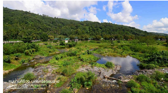
รูปที่ 2 แสดงภาพมุมมองสูงภายในหมู่บ้านคีรีวง จ.นครศรีธรรมราช

4.2 ลักษณะทางกายภาพของชุมชนห้วยพ่าน จากทฤษฎีของ Kevin Lynch ว่าด้วยเรื่อง Image of city ทั้ง 5 อัน ประกอบด้วย ขอบเขต (Edge) จุดศูนย์กลางรวม (Node) เส้นทาง (Path) ย่าน (District) และ จุดหมายตา (Landmark) (กำจร กุลชล , 2545) นำมาวิเคราะห์ผลพบว่า ลักษณะของชุมชนมีการตั้งฐานด้วยหลักการภูมิศาสตร์ โดยชุมชนวางกลุ่มบ้านเรือนในแนวพื้นที่ราบลุ่มของหุบเขา ตามแนวแม่น้ำน่าน อาศัยภูเขาและแม่น้ำน่านเป็นขอบเขตจึงทำให้ชุมชนปกคลุมแวดล้อมด้วยธรรมชาติ มีพื้นที่ย่านอันประกอบด้วย ย่านที่อยู่อาศัย ย่านสถานการศึกษา ย่านเกษตรกรรม มีการจัดสรรพื้นที่ ตามสภาพภูมิประเทศที่มีความลาดชัน อาศัยความสูงต่ำของพื้นที่ เป็นเส้นแบ่งความเป็นย่านของชุมชน โดยย่านแต่ละย่าน ยังขาดจากการเชื่อมโยงจุดกิจกรรมการท่องเที่ยวกับชุมชนในพื้นที่และการต่อเนื่องกับเส้นทางริมแม่น้ำน่านอย่างเป็นระบบ ในชุมชนมีจุดศูนย์กลางชุมชนที่สำคัญ คือ บ้านผู้ใหญ่บ้าน โรงเรียน และวัด มีจุดหมายตา คือ สะพานแขวน จุดกิจกรรมทางน้ำ พื้นที่รมน้ำ และทุ่งนาขั้นบันได ดังแสดงในรูปที่ 3 ซึ่งถูกปล่อยให้ทรุดโทรมและขาดการดูแลจัดการให้ตอบรับกับการท่องเที่ยว หากได้มีการพัฒนาสิ่งต่าง ๆ เหล่านี้ให้เกิดเป็นระบบ สอดคล้องวิถีชีวิต