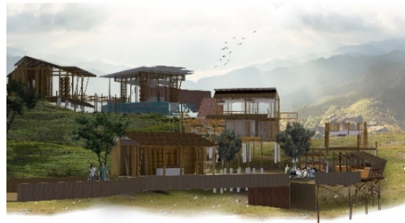
รูปที่ 8 แสดงภาพโครงการศูนย์การต้อนรับนักท่องเที่ยวและส่งเสริม กิจกรรมทางน้ำ

โครงการที่ 2 กลุ่มที่พักอาศัยโฮมสเตย์ ร้านค้าชุมชน และทางเดินริมน้ำ ตั้งอยู่ตำแหน่ง B ดังแสดงในรูปที่ 9 เป็นจุดสำคัญของโครงการในการกระจายนักท่องเที่ยวไปยังพื้นที่กิจกรรมต่างๆ การออกแบบเน้นสร้างประสบการณ์ดึงดูดลักษณะของชุมชน และจุดเด่นในพื้นที่ให้กับนักท่องเที่ยวได้สัมผัสในความหลากหลายของกิจกรรมและความงามของแม่น้ำน่านและธรรมชาติ เสริมสิ่งอำนวยความสะดวกให้แก่นักท่องเที่ยว เช่น ร้านค้าชุมชน ที่พักโฮมสเตย์ ห้องน้ำม้านั่ง ทางจักรยาน ป้ายบอกทาง โคมไฟ และถังขยะ เป็นต้น เพื่อเป็นเส้นทางแห่งการเรียนรู้วิถีชีวิต กิจกรรมประเพณี และการท่องเที่ยวเชิงนิเวศ ที่จะสร้างเศรษฐกิจชุมชนในพื้นที่ ดังแสดงในรูปที่ 10 และ 11