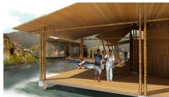
รูปที่ 14 แสดงทัศนียภาพศูนย์การเรียนรู้การทำนา