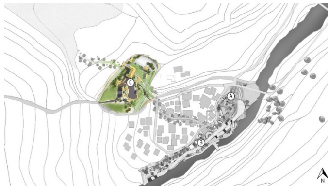
รูปที่ 12 เสนอแนะการวางผังศูนย์การเรียนรู้วิถีชีวิตห้วยพาน

โครงการที่ 3 ศูนย์การเรียนรู้วิถีชีวิตห้วยพาน ตั้งอยู่ตำแหน่งที่ C ดังแสดงในรูปที่ 12 โดยให้นักท่องเที่ยวได้เรียนรู้วิถีชีวิตของชุมชนห้วยพานและการทำงานขั้นบันไดแบบดั้งเดิม ประกอบด้วย ศูนย์การเรียนรู้การทำนา ศูนย์การเรียนรู้วิถีชีวิต โรงเรียน ห้องสมุด ศาลารวมพลชุมชน ที่จอดรถยนต์และที่จอดรถจักรยาน ออกแบบโดยใช้ธรรมชาติเป็นตัวจัดสรร มีการดึงน้ำจากห้วยพานมาใช้ออกแบบภายในโครงการเพื่อการใช้งานในกิจกรรม สร้างเส้นทางเชื่อมโยงไปยังพื้นที่ทำนาเพื่อให้นักท่องเที่ยวเข้าถึงและเรียนรู้วิถีชีวิตการทำนาแบบดั้งเดิม ดังแสดงในรูปที่ 13 และ 14