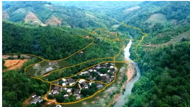
รูปที่ 4 แสดงพื้นที่ชุมชนบ้านห้วยพ่าน อ. เชียงกลาง จ. น่าน