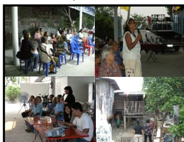
รูปที่ 5 แสดงการประชุมสัมมนาเชิงปฏิบัติการเพื่อสรุปข้อมูลและหาแนวทางการแก้ไขปัญหาร่วมกัน

3) ขึ้นสรุปและวิเคราะห์ข้อมูล ผ่านการสัมภาษณ์ชาวชุมชนและประชุมสัมมนาเชิงปฏิบัติการ มีเป้าหมายเพื่อสรุปข้อมูลลักษณะ-สาเหตุของปัญหาและหาแนวทางการแก้ไขปัญหาในรูปแบบต่าง ๆ ร่วมกัน โดยมีการบันทึกรูปแบบและผลที่ได้จากการมีส่วนร่วมในการประชุม (รูปที่ 5)