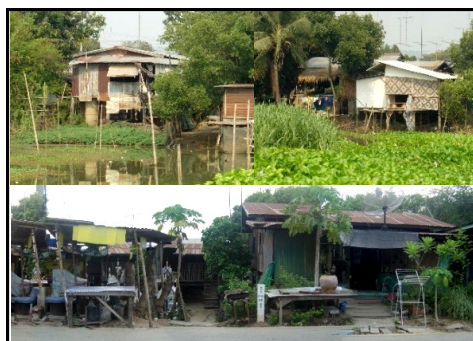
รูปที่ 2 ลักษณะสิ่งปลูกสร้างในบริเวณพื้นที่ริมน้ำ ชุมชนศรีวิชัย

ชุมชนศรีวิชัยมีปัญหาด้านที่อยู่อาศัยที่สำคัญได้แก่บริเวณกลุ่มผู้นุ่กรูกริมน้ำ ซึ่งเป็นปัญหาจากที่ชาวบ้านย้ายจากการอยู่อาศัยแบบเรือนแพขึ้นมาปลูกสร้างอาคารพักอาศัยถาวรริมถนนเลียบบแม่น้ำ เมื่อจำนวนผู้อยู่อาศัยเพิ่มขึ้น จึงมีการปลูกสร้างอาคารที่อยู่อาศัยขยายออกไป โดยสภาพที่อยู่อาศัยบริเวณริมแม่น้ำในชุมชนส่วนใหญ่สร้างด้วยวัสดุที่ไม่ถาวร ได้แก่ ไม้ สังกะสี แผ่นซีเมนต์ ซึ่งวัสดุทั้งหลายต่างผุพังและมีสภาพทรุดโทรม (รูปที่ 2) นอกจากนี้พื้นที่ในที่อยู่อาศัยบางหลังยังมีขนาดคับแคบมากเนื่องจากการสร้างแทรกขึ้นระหว่างอาคารหลังอื่น จึงไม่มีพื้นที่ว่างรอบบ้านและไม่มีช่องแสง-ระบายอากาศที่เพียงพอ ตลอดจนบางหลังยังได้รับผลกระทบจากน้ำท่วมอยู่อย่างต่อเนื่องอีกด้วย