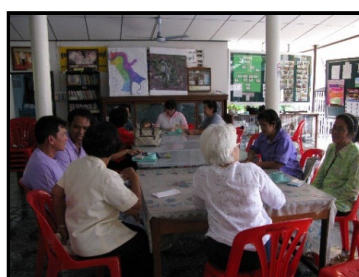
รูปที่ 6 การประชุมสัมมนาเชิงปฏิบัติการเพื่อสรุปแนวทางการแก้ไขปัญหาที่อยู่อาศัยในชุมชน

4) ขึ้นสรุปแนวทางการแก้ไขปัญหาที่อยู่อาศัยในชุมชนผ่านการประชุมสัมมนาเชิงปฏิบัติการ มีเป้าหมายเพื่อสรุปแนวทางการแก้ไขปัญหาที่อยู่อาศัยของชุมชนนาร่อง (ชุมชนศรีวิชัย) และสร้างความเข้าใจในการแก้ไขปัญหาร่วมกันระหว่างหน่วยงานรัฐและชุมชน โดยมีการบันทึกรูปแบบและผลที่ได้จากการมีส่วนร่วมในการประชุม (รูปที่ 6)