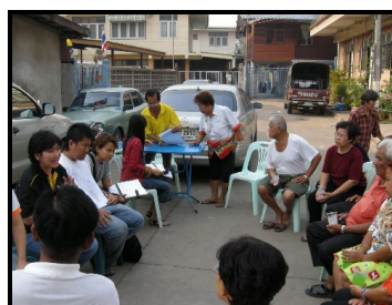
รูปที่ 4 แสดงการประชุมสัมมนาเชิงปฏิบัติการเพื่อเตรียมความพร้อมและสรุปภาพรวมปัญหาและความต้องการที่เกิดขึ้นในชุมชน

2) ขั้นตอนเตรียมความพร้อมของชุมชน หน่วยงานท้องถิ่น และหน่วยงานระดับจังหวัด ผ่านการประชุมสัมมนาเชิงปฏิบัติการชุมชนและตัวแทนชุมชน มีเป้าหมายเพื่อสร้างความตระหนักถึงปัญหาและแรงจูงใจในการมีส่วนร่วมแก้ไขปัญหา นอกจากนี้ยังมีการสร้างกระบวนการออมทรัพย์เพื่อใช้ดำเนินการในการปรับปรุงที่อยู่อาศัย โดยได้รับการสนับสนุนและขับเคลื่อนกระบวนการจากสถาบันพัฒนาองค์กรชุมชน (องค์การมหาชน) (รูปที่ 4)