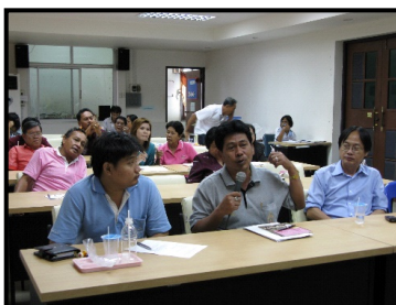
รูปที่ 7 แสดงการประชุมร่วมกับหน่วยงานระดับจังหวัด ท้องถิ่นและผู้นำชุมชนและตัวแทนชุมชนศรีวิชัย

5) ขึ้นนำเสนอสรุปผลการศึกษาต่อจังหวัดฯ มีเป้าหมายนำเสนอแนวทางการแก้ไขปัญหาที่อยู่อาศัยในชุมชนเพื่อนำไปใช้ปฏิบัติการในพื้นที่ต่อไป โดยมีการบันทึกรูปแบบและผลที่ได้จากการมีส่วนร่วมในการประชุม (รูปที่ 7)