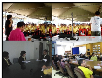
รูปที่ 3 แสดงการประชุมร่วมกับหน่วยงานระดับจังหวัด,ท้องถิ่น, ผู้นำชุมชนและตัวแทนชุมชนศรีวิชัยและม.รังสิต

1) ขั้นตอนเตรียมโครงการ ประสานงานและชี้แจง ชุมชน หน่วยงานท้องถิ่น และหน่วยงานระดับจังหวัด มีเป้าหมายเพื่อสร้างความเข้าใจในการดำเนิน โครงการและสร้างความสัมพันธ์ร่วมกันระหว่างคณะผู้ศึกษา จังหวัดท้องถิ่น และประชาชนร่วมกัน (รูปที่ 3)