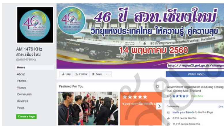
รูปที่ 1 แสดงแฟนเพจเฟซบุ๊กวิทยุชนเผ่า AM 1476 KHz (สวท.เชียงใหม่)

จัดรายการนำข้อมูลมาใช้พัฒนาการจัดการผลิตรายการ ส่งตรงไปยังกลุ่มเป้าหมายเฉพาะ (direct group) และช่วยลดปัญหาข้อจำกัดทางด้านเวลาและพื้นที่ที่เผยแพร่ เนื่องจากผู้รับฟัง/รับชมรายการติดตามรับชมย้อนหลังได้ และไม่จำเป็นต้องรับฟังผ่านรายการวิทยุที่ใช้คลื่นวิทยุที่มีระยะการกระจายเสียงจำกัด ทำให้รายการวิทยุชนเผ่าพัฒนาการดำเนินงานได้อย่างต่อเนื่อง (ชนิสรา ชมศิลป์, สัมภาษณ์, 18 ตุลาคม 2559)