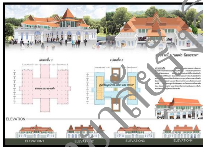
รูปที่ 4 แบบร่างที่ 2 คริวตรัง คริวไทย คริวโลก

แบบร่างที่ 2 แบบนี้ ได้แนวความคิดมาจากความรุ่งเรืองทางด้านวัฒนธรรมของเมืองตรัง อันเกิดมาจากการรวมกลุ่มของหลายชาติพันธุ์ รูปแบบสถาปัตยกรรมของแบบร่างที่ 2 จึงมีความผสมผสานระหว่างรูปแบบสถาปัตยกรรมพื้นถิ่นของภาคใต้ และเรือนมลายู โดยเลือกใช้หลังคาปั้นหยามนิลา การขึ้นชายคาและมีค้ำยันรองรับ ส่วนชั้นล่างออกแบบด้วยแนวคิดสถาปัตยกรรมชิโน โปรตุกีส ที่มีการใช้ช่องโค้ง การใช้ระเบียงด้านบน รวมไปถึงการเน้นรูปแบบอาคารเป็นแบบก่ออิฐฉาบปูน ส่วนการจัดวางผังอาคารภายในนั้น ชั้นล่างได้จัดวางจำหน่ายสินค้าประเภทของสดและของแห้ง ส่วนชั้นสองจัดพื้นที่เป็นศูนย์ข้อมูลนักท่องเที่ยว และจำหน่ายสินค้า OTOP ของจังหวัดตรัง ซึ่งถือว่าเป็นพื้นที่หนึ่งในการแสดงวัฒนธรรมของเมืองตรัง