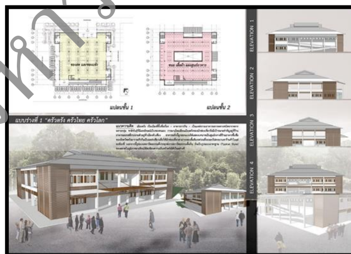
รูปที่ 3 แบบร่างที่ 1 คริวตรง คริวไทย คริวโลก