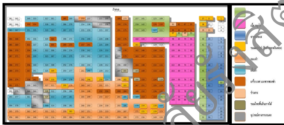
รูปที่ 1 แผนที่ตลาดสดเทศบาล แสดงจำนวนแผงและประเภทของสินค้า

จากการสำรวจแผนผังรูปที่ 1 แสดงให้เห็นถึงการจัดแบ่งพื้นที่ประเภทสินค้าเนื้อหมู เนื้อไก่ อาหารทะเล และผัก ที่ค่อนข้างชัดเจน และมีการจัดวางประเภทสินค้าอย่างต่อเนื่อง สามารถเข้าถึงได้สะดวก อย่างไรก็ตามมีการจัดวางพื้นที่ที่ทับซ้อนของสินค้าบางประเภท เช่น รองเท้า, เสื้อผ้า, ข้าวสาร, ขนมไทยพื้นถิ่นภาคใต้ และ อุปกรณ์ทางการเกษตร ทำให้เกิดความสับสนในการเข้าถึงของคนต่างถิ่น ส่งผลถึงยอดขายสินค้าของผู้ประกอบการลดลง