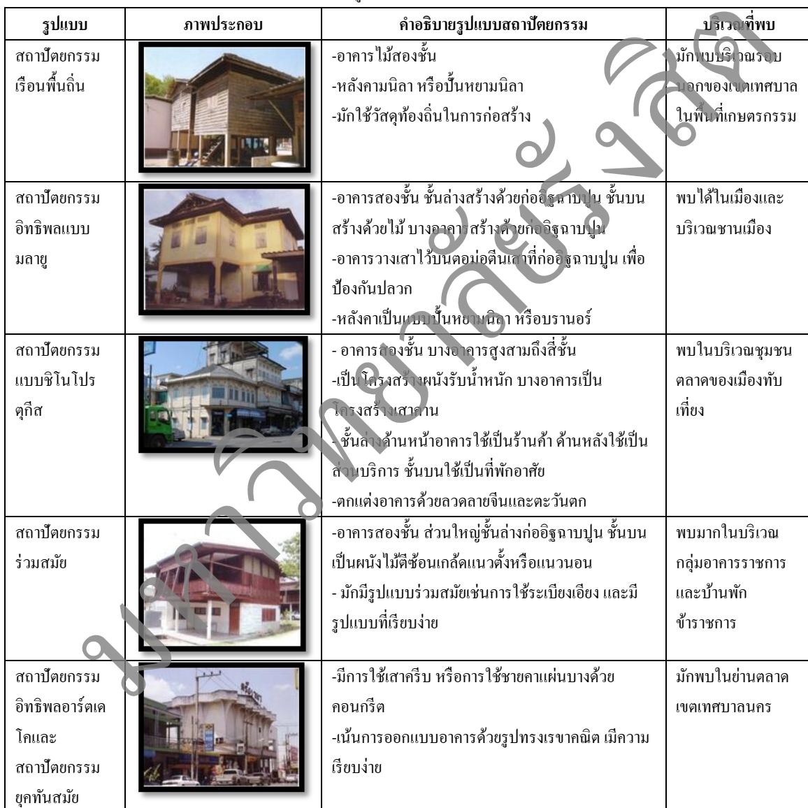
ตารางที่ 2 ตารางรูปแบบสถาปัตยกรรมในเมืองทับเที่ยง

จากผลการสำรวจและรวบรวมข้อมูลพื้นที่ทางภาคสนาม และการศึกษารูปแบบสถาปัตยกรรมพื้นถิ่นของเมืองทับเที่ยง สามารถสรุปปัญหาของการเสื่อมสภาพของตลาดเทศบาลนครตรังได้ดังนี้