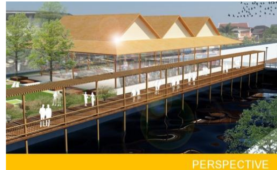
รูปที่ 5 บรรยากาศจำลองร้านค้าริมน้ำ

การอนุรักษ์สถาปัตยกรรมและสิ่งแวดล้อมชุมชน ต้องพัฒนาควบคู่กับการพัฒนาเศรษฐกิจ โดยมุ่งพัฒนาวิถีชีวิตชุมชน ให้เข้มแข็งพึ่งตนเองได้ (กระทรวงมหาดไทย, 2541) ชุมชนช่วยกันดูแลทรัพยากรธรรมชาติและสิ่งแวดล้อม โดยยึดวิถีชีวิตอันผูกพันกันทางวัฒนธรรม และที่สำคัญคือวัฒนธรรมการดำรงวิถีชีวิตแบบดั้งเดิม คนในชุมชนเป็นผู้มีบทบาทเป็นอย่างมาก และยังทำหน้าที่ในการอนุรักษ์สถาปัตยกรรม และสิ่งแวดล้อม