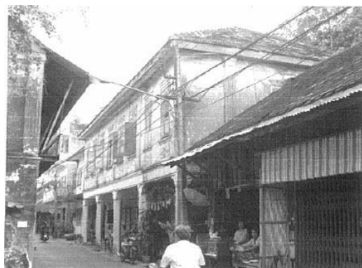
รูปที่ 2 รูปแบบสถาปัตยกรรมชุมชน

ทางผู้วิจัยได้นำเสนอแผนพัฒนาการอนุรักษ์การออกแบบวางผังชุมชนท่าหลวงให้กับผู้นำชุมชน และคนในชุมชนได้ข้อสรุปจากประชาชนในพื้นที่ดังนี้ ส่วนใหญ่เห็นด้วยกับแนวทางและมีความเข้าใจถึงความสำคัญของสิ่งแวดล้อมที่มีต่อมรดกทางวัฒนธรรมของชาติ และคนในชุมชนมีบทบาทสำคัญในการอนุรักษ์สิ่งแวดล้อมศิลปกรรม มีการดูแลรักษา การควบคุมและป้องกัน รวมทั้งการบันทึกและจัดเก็บข้อมูลอย่างเป็นระบบ คนในชุมชนต้องการที่จะอนุรักษ์ชุมชนท่าหลวงไว้ จึงมีแนวคิดที่จะพัฒนาส่งเสริมด้านการท่องเที่ยว และทำให้ชุมชนมีรายได้เพิ่มมากขึ้นตามแนวทางการพัฒนาชุมชนที่ยั่งยืน