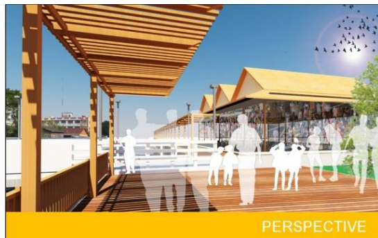
รูปที่ 4 การออกแบบทางเดินริมน้ำ

ชุมชน รวมถึงงบประมาณในการปรับปรุงทางกายภาพ รวมถึงการบริหารจัดการชุมชนในด้านต่างด้วย