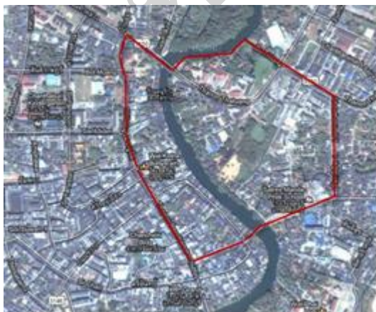
รูปที่ 1 ชุมชนท่าหลวง จังหวัดจันทบุรี

เป็นการวิจัยเชิงประยุกต์ ความหมายการพัฒนาชนบทของการวิจัยนี้คือ การออกแบบวางผังชุมชนชนบท และกำหนดแผนการพัฒนาชุมชน สํารวจสัมภาษณ์ วิเคราะห์ ออกแบบ และ นำเสนอ โดยใช้กระบวนการมีส่วนร่วมจากชุมชนทุก ภายใต้งานตอนการศึกษา ดังต่อไปนี้ 1) ศึกษาบริบทชุมชน หรือสภาพทั่วไปของชุมชน 2) วิเคราะห์ แผนพัฒนาชุมชน/ยุทธศาสตร์จังหวัด/ยุทธศาสตร์ประเทศ เครือข่าย ภาค ประชาชน กำลังเคลื่อนไปสู่ 3) ศึกษากลุ่มชาติพันธุ์ ประวัติความเป็นมาชุมชน สัญลักษณ์ชุมชน อาชีพ ความเชี่ยวชาญ ประสิทธิภาพการพัฒนา 4) สํารวจ และ ทำแบบสอบถามเรื่องทัศนคติ / แนวคิด / พฤติกรรมการทำงาน ร่วมกับในชุมชน 5) กำหนดการใช้ประโยชน์ที่ดิน โดยการแบ่งโซน พักอาศัย โซนพาณิชยกรรม ส่วนสาธารณะ ส่วนราชการ รวมถึง ระบบคมนาคม การเข้าถึงพื้นที่ 6) ออกแบบสถาปัตยกรรม และวางผังชุมชนให้ สอดคล้องกับหลักสิทธิชุมชน ให้ชุมชนเป็นศูนย์กลางการพัฒนา นำเสนอแนวคิดการพัฒนาอย่างยั่งยืน ได้แก่ การอนุรักษ์ การฟื้นฟู การสืบทอด รวมถึง การพัฒนาเชิงระบบ และการพัฒนาแบบองค์รวม