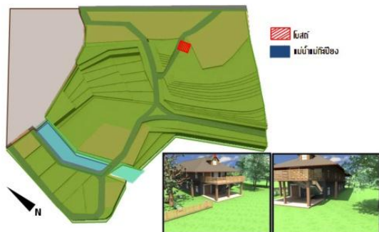
รูปที่ 2 ลานกิจกรรมชุมชน การแสดง และแหล่งพักผ่อน